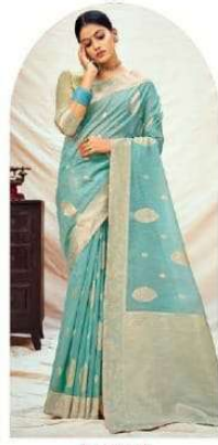
|| 1002 ||