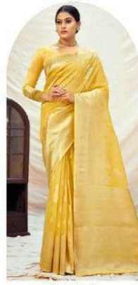
|| 1001 ||