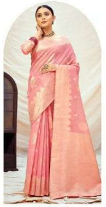
|| 1003 ||