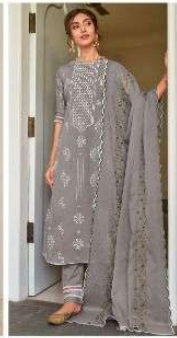
JEG | 7030