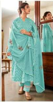
JEG | 7026