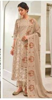
JEG | 7028