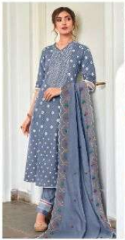
JEG | 7024