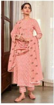
JEG | 7021