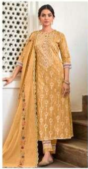
JEG | 7025