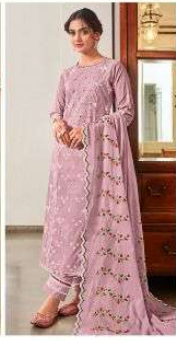
JEG | 7023