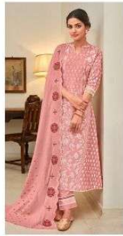
JEG | 7029