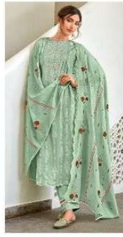
JEG | 7027