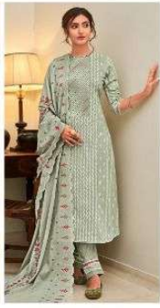
JEG | 7022