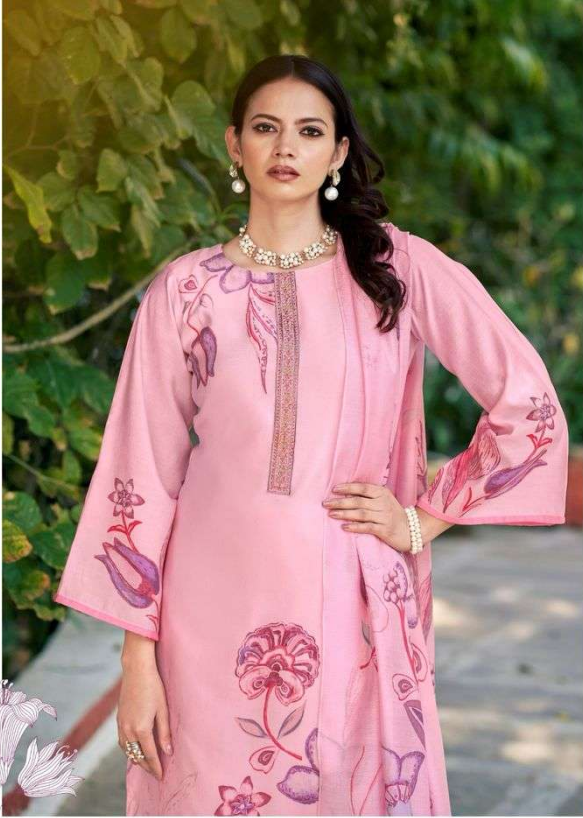
The elegant floral print flaunts a refined taste in wear.