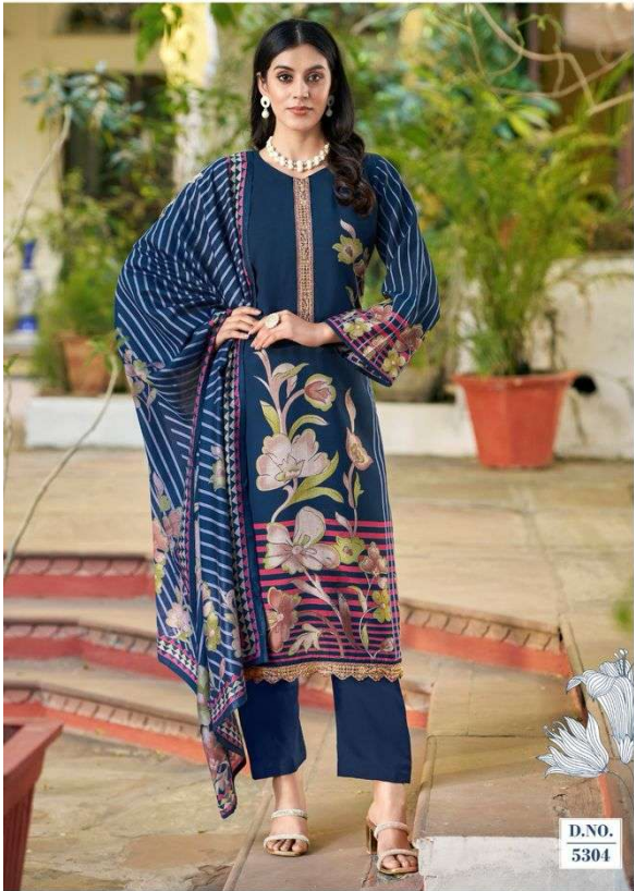
The elegant floral print flaunts a refined taste in wear.