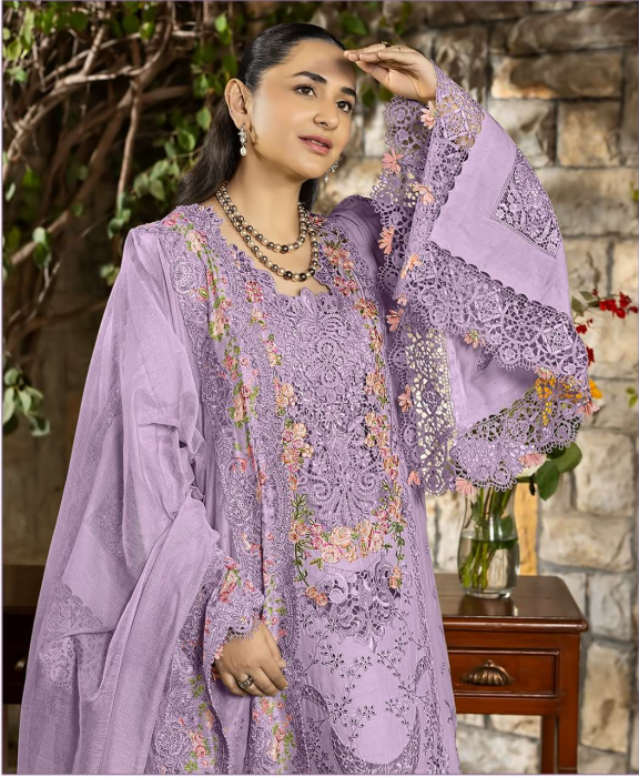
ombré Premium VOL - 10