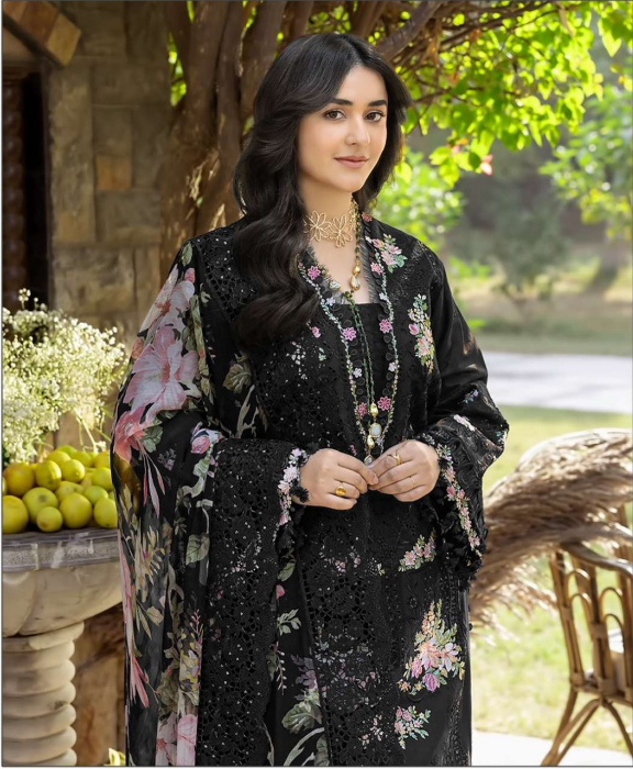
ombré Premium VOL - 10