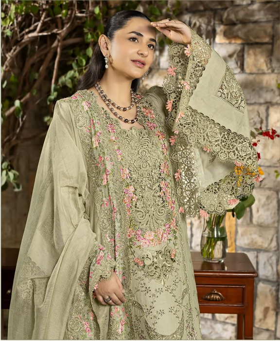
ombré Premium VOL - 10