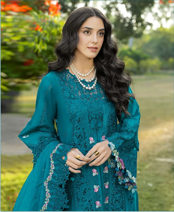
ombré Premium VOL - 10