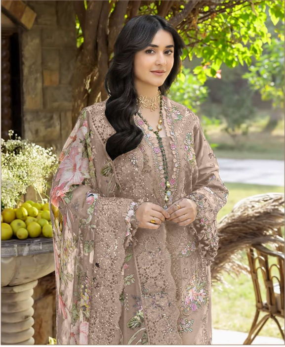
ombré Premium VOL - 10