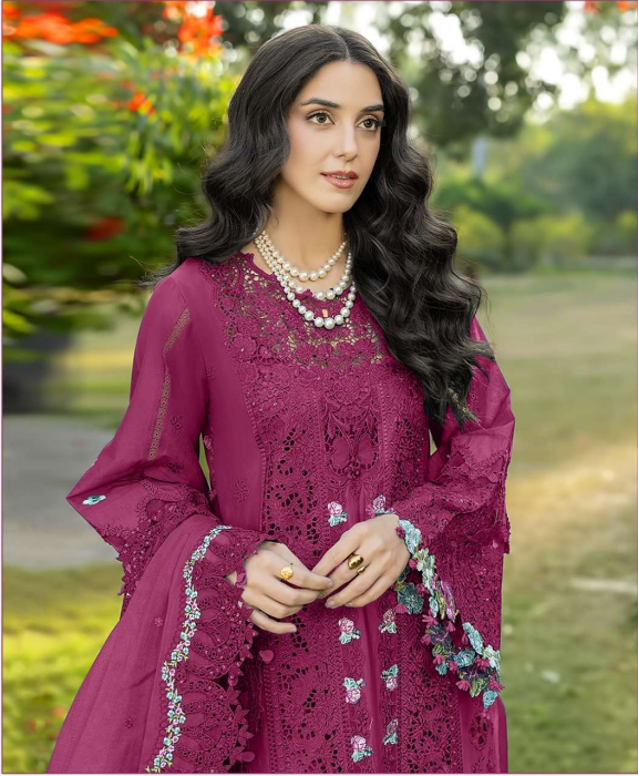
ombré Premium VOL - 10